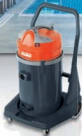
Hako-Supervac L 2-70