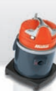
Hako-Supervac L 1-15