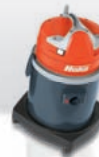
Hako-Supervac L 1-30