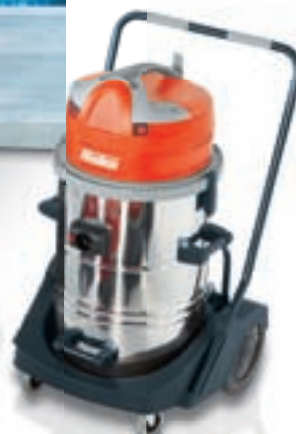
Hako-Supervac L 3-70 I